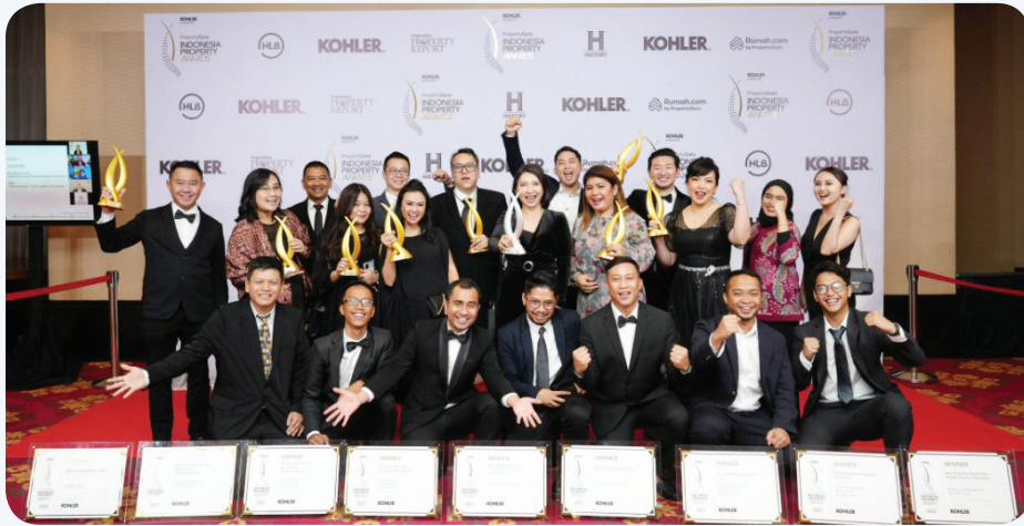
Jajaran Sinar Mas Land dengan sembilan penghargaan bergengsi dari ajang PropertyGuru Indonesia Property Awards 2022.