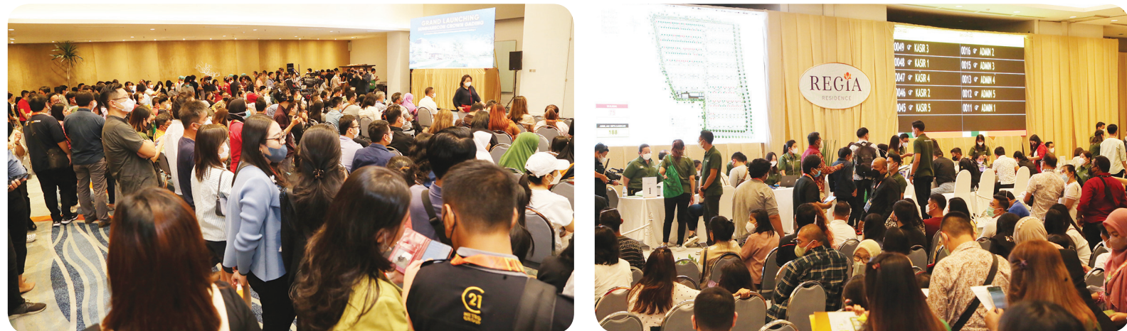
Peminat yang tinggi, penjualan dibuka hingga tahap 2 dan tahap 3.

Pada launching perdana Summarecon Crown Gading, dari penawaran awal kami sebanyak 244 unit untuk Cluster Jasmia Residence dan Cluster Regia Residence, kami berhasil menjual 390 unit hanya dalam waktu 6 jam.