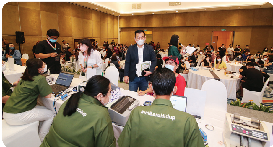
Launching perdana Summarecon Crown Gading.

Di jantung The Florana, penghuni dapat menikmati green spine yang memiliki kesejukan alami, ruang hijau, dan tempat dimana setiap kegiatan luar ruangan menjadi momen terindah. • kris