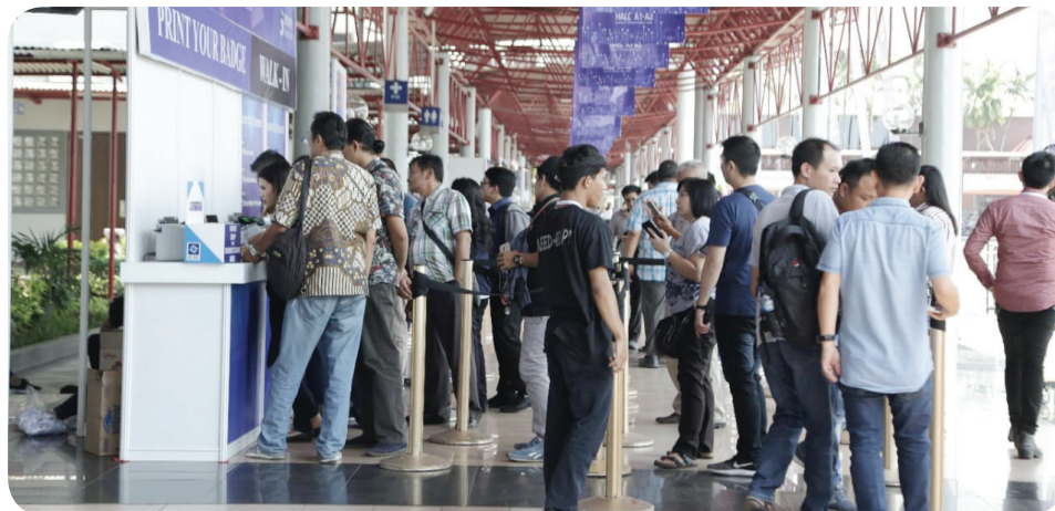
Sejumlah pengunjung memadati area pameran sebelumnya.

melihat industri produk bayi dan mainan di Indonesia sudah banyak yang menggunakan teknologi 4.0 sehingga lebih mudah untuk mengikuti tren yang ada dan bersaing pada pasar global. Dengan adanya kebijakan sekolah daring juga menjadi salah satu pendukung dalam memulihkan industri mainan. Lebih banyak nya waktu anak dirumah sehingga kebutuhan akan mainan untuk mengisi waktu menjadi meningkat, dimulai dari mainan tradisional, edukatif hingga mainan digitalisasi yang lebih efisien," kata Ketua Umum